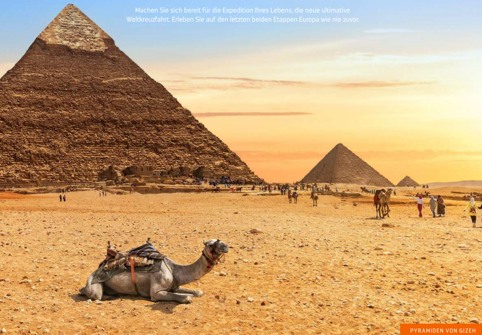
PYRAMIDEN VON GIZEH

Machen Sie sich bereit für die Expedition Ihres Lebens, die neue ultimative Weltkreuzfahrt. Erleben Sie auf den letzten beiden Etappen Europa wie nie zuvor.