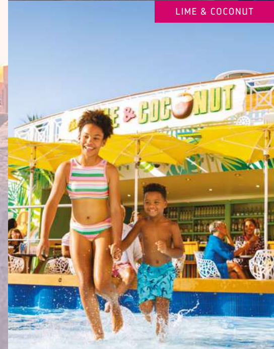
LIME & COCONUT